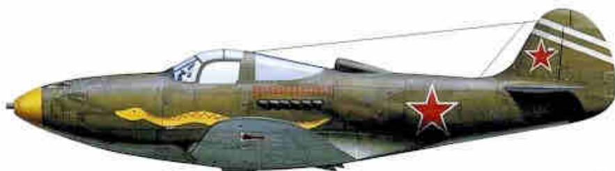
Р-39N (серийный номер неизвестен), летчик - майор Султан Амет-Хан, 9-й ГвИАП, аэродром «Мелитополь», сентябрь 1943. На эскизе самолёт изображён как истребитель, хотя на самом деле художники изображают эту машину с крыльями козыли. Однако по историческим источникам именно 3-й эскадрилья Султана Амет-Хана была истребительной.

1071 сенеси февраль 1-де ойле учаълардан бирисини сынагъанда фаджиалы эляк олды. Февраль 8-де Москвадаки Ново-Девичье мезарлыгъында арбий итирам иле дефн этильди.