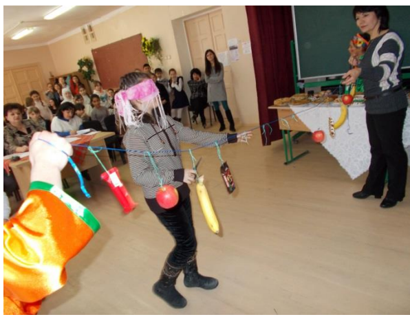
Скоморох 2. (Слайд 13)